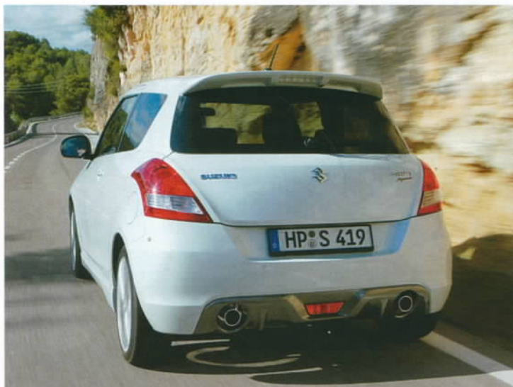
Ze zadního difuzoru vyčuhují VÝHRUŽNĚ ZNĚJÍCÍ KONCOVKY dvojitého výfuku

Těch 136 koní nabízených benzínovou šestnáctistovkou můžete mít už za 369 900 Kč. Kromě schopné-