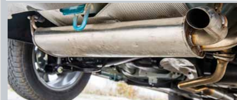
Velký tlumič pod autem i vzadu spolehlivě zvládají pulzace tříválců. Litr je u značky Suzuki jediný, který má filtr GPF, a tudíž neušpiněnou koncovku.