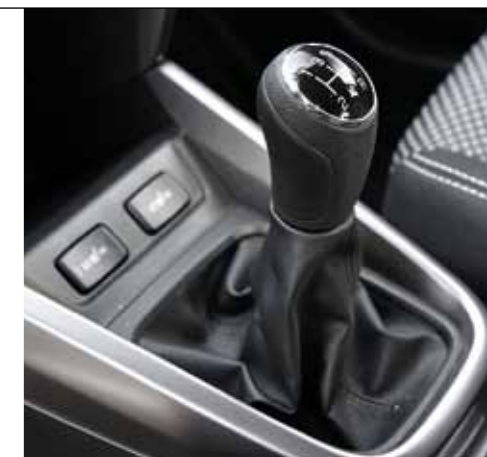
Převodovka má jen pět stupňů, ale velmi dobře poskládaných. Jednička zvládne i náročné manévrování v terénu, trojku vytočíte do 130 km/h, čtyřku do 160 km/h.

na nějakých 1300 otáček – jak se to učilo v autoškole. Třeba ve Škodě Fabia 1.0 TSI jakmile se dotknete plynu, hned je tam nesmyslných 2500 min -1 . Pak se někdo diví, že hoří spojky. Za rozjezdy dáváme jedničku, přirozenost je mnohem lepší, než když si motor pod plynem žije vlastním životem.