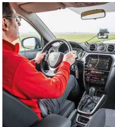
Pětistupňové převodovky nezatrácujeme. Umožňují trvalou jízdu mimo město bez řazení, což je mnohým motoristům příjemné. Měření potvrdilo slušnou pružnost.

Bohužel ve vyšších rychlostech nedokázal motor ve spojení s pětistupňovou převodovkou agilněji přemáhat odpory karoserie. Na 160 km/h už to trvalo 33,4 s, což je až páté místo. Ve vztahu ke konkurentům to znamená známku 3.