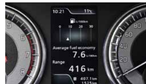
Na 7,6 l/100 km nám průměr vystoupal jen při vyložené ostré jízdě. Naměřili jsme 6,4 l/100 km, čímž se přesně shodujeme například s německými uživateli na serveru Spritmonitor.de.

Stejně však jsou jízdní odpory (hodnocené na základě technických údajů a orientační dojezdové zkoušky) po Fiatu 500X druhé nejvyšší a motoru 1.0 BoosterJet je kompenzujeme známkou 1,5.