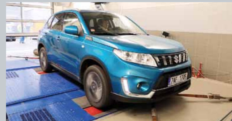
Absolutní naměřené hodnoty nejsou nic moc, ale průběh točivého momentu vyhoví jak defenzivním, tak aktivnějším řidičům. Jediné suzuki za něj dostává jedničku i proto, že křivky jsou plynulé bez houpání.

konkurentů – místo 10,5:1 jen rovných 10. Těž naměřený tlak v sání 203 kPa (to znamená, že turbodmychadlo „tlačí“ 101 kPa – zhruba jednu atmosféru) patří společně s opelem a kiou k nižším. Citelně méně má už jen fiat. Sklony ke zhoubnému klepání jsou tudíž u suzuki už z principu nižší než u většiny konkurentů. Co je za B, to vysvětlíme za chvíli.