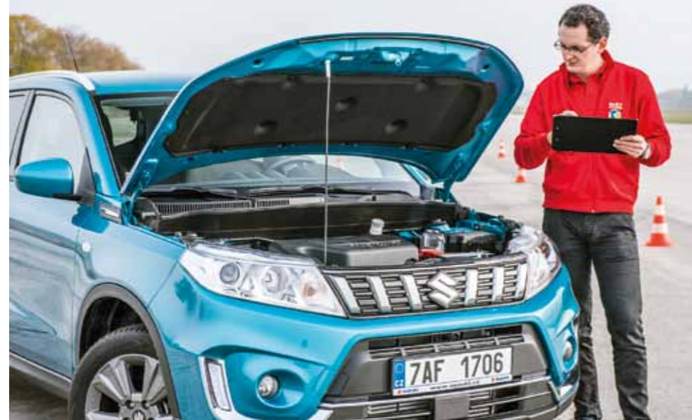
Byť papírové předpoklady nebyly zrovna skvělé, ve zrychlení z klidu na 100 km/h i v absolutní dynamice si motor Suzuki Booster Jet vedl překvapivě dobře

Suzuki je společně s opelcem jedním ze dvou výrobců, kteří u litrů „nad sto koní“ nabízejí stále jen pětistupňovou převodovku. Pokud však převažujícím kupujícím těchto aut nebude motoristický nadšenec, ale normální uživatel, který v jízdě autem nespaturuje seberealizaci, pak toto masivně nekritizujeme. Pětistupňová převodovka totiž umožňuje mimo město jízdu zcela bez řazení, kdežto šestistupňová ústrojí po řidiči kolem osmdesátky obvykle žádají „akci s řadicí pákou“. Přesně tak fungovalo i suzuki – kdyby člověku