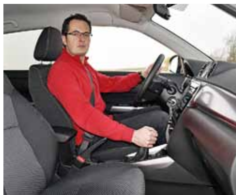
Vzadu se „sám za sebe“ 187 cm vysoký redaktor posadil už jen tak tak

N enajdete moc racionálních důvodů, proč místo kulatého modelu S-Cross zvolit hranatou vitaru. Malé SUV vzniklo zkrácením jeho rozvoru o celých deset centimetrů – z 2600 na 2500 mm a z reálně čtyř- až pětimístného auta se stal stroj pro dva dospělé a dvě děti. Možná namítnete, že S-Cross není tak hezký a ve výbavě Premium je o 11 000 Kč dražší (441 900 Kč proti 430 900 Kč, které dáte za testovanou vitaru). O designu se hádat nebudeme, ale tu cenu bychom si dovolili rozporovat. S-Cross má za zanedbatelný příplatek navíc i některé prvky výbavy: třeba dvouzónovou automatickou klimatizaci místo jednozónové, samostmívací vnitřní zpětné zrcátko, bezklíčový přístup a startování, hlavní světlomety LED a směrovky ve vnějších zpětných zrcátkách. Na zadních sedacích je nejen podstatně víc místa, ale jejich sklon lze ve dvou stupních nastavit a je zde loketní opěrka. Zkrátka z našeho pohledu je lepší auto S-Cross, a pokud se dvakrát víc prodává vitara, je to čistě věc designu.